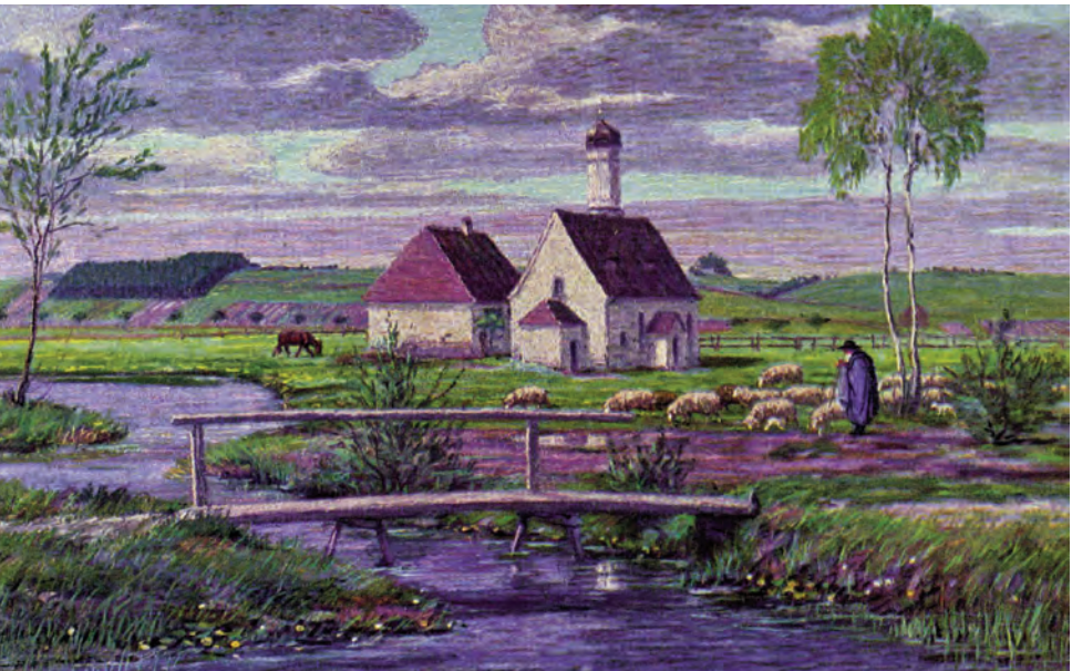
Im Benninger Ried (1920) Bild in Öl von Josef Madlener